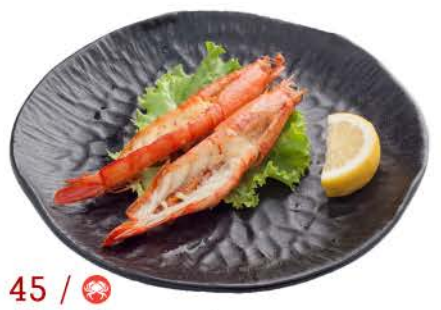
Gamberoni prawns € 8,00 / 2pz