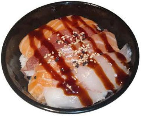
C2 / ○ ○ ○ ○ ○ ○ Chirashi Misto Don ciotola di riso con salmone branzino,tonno,salsa bowl of rice with salmon sea bass, tuna, sauce € 5,00