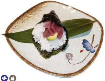
T2 / Maguro Temaki avocado,tonno,riso,alghe avocado, tuna, rice, seaweed € 4,00