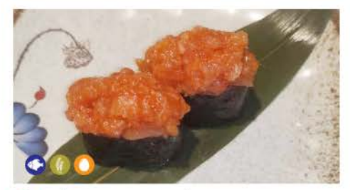
G1 / Spicy Salmone salmone piccante, maionese spicy salmon, mayonnaise € 3.00