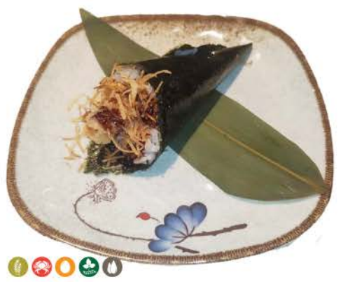
T4 / Ebiten Temaki gamberoni fritti,riso,alghe salsa teriyaki fried prawns, rice, seaweed teriyaki sauce € 4,00