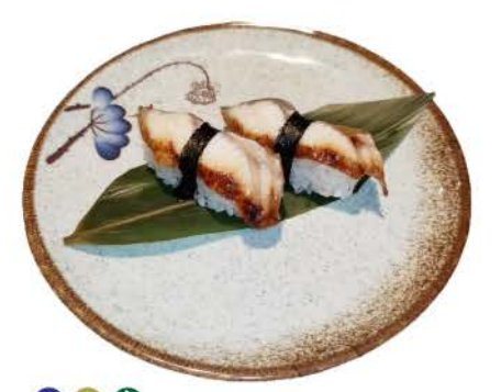
N7 / Unagi anguilla riso,alghe eel,rice,seaweed € 3,00