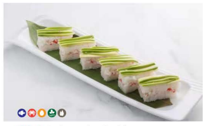
O2 / Oshizushi California rettangoli di riso,surimi,avocado salsa di maionese piccante rice rectangles.surimi, avocado spicy mayonnaise sauce € 9,00