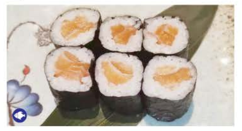
H1 / Sake Maki salmone, riso, alghe salmon, rice, seaweed € 5,00