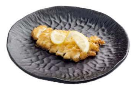
38 / ① Pollo al Limone chicken with lemon € 7,00