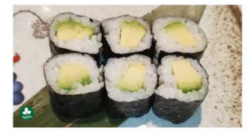
H4 / Avocado Maki avocado, riso, alghe avocado, rice, seaweed