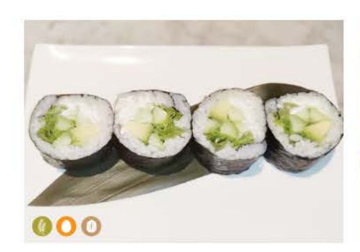
F4 / Verdure verdure miste, philadelphia mixed vegetables, philadelphia € 5,00