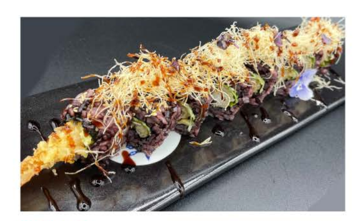
B3 / ③ ⑤ Black Ebiten riso venere con gamberoni fritti,salsa teriyaki black rice with fried prawns, teriyaki sauce € 10,00