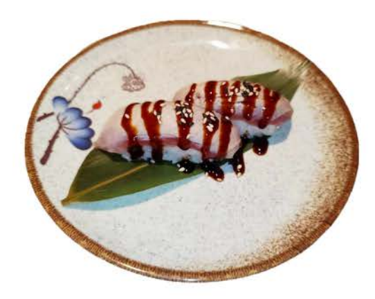
P13 / Nigiri Maguro Fire tonno scottato seared tuna € 3,50