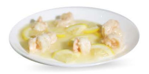
35 / @ Gamberetti al Limone shrimp with Lemon € 7,00