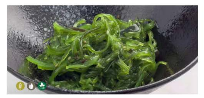
01 / Goma Wakame

insalata di alghe piccanti con sesamo spicy seaweed salad with sesame € 3.00