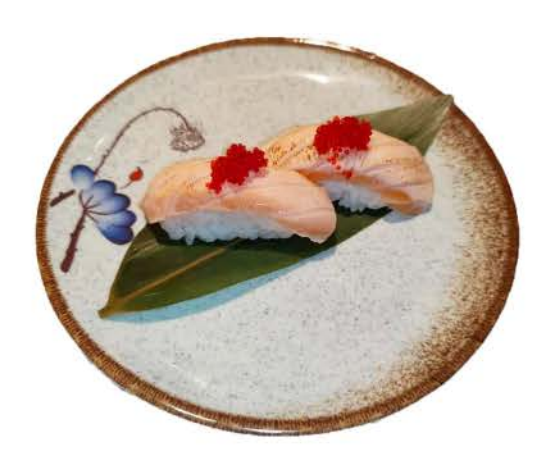
P14 / ◆ Nigiri Salmone Fire salmone scottato seared salmon € 3,00