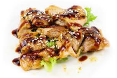
44 / © Cosce di Pollo alla Griglia cosce di pollo alla griglia grilled chicken legs € 5,00