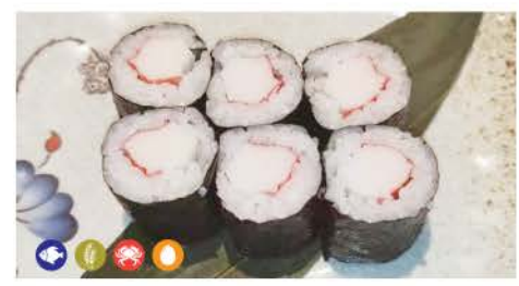
H3 / Surimi Maki surimi di granchio,riso,alghe crab surimi, rice, seaweed € 5,00