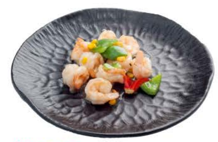
34 / ② ② Gamberetti tre Colori shrimp three colors € 7,00