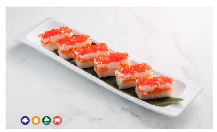
O1 / Oshizushi Sake rettangoli di riso,salmone,tobiko salsa teriyaki rectangles of rice, salmon, tobiko teriyaki sauce € 8,00