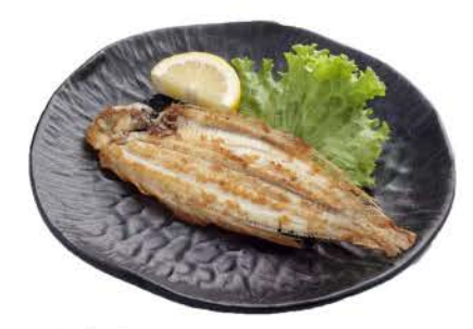
48 / ◆ Sogliola sogliola alla griglia grilled sole € 10,00