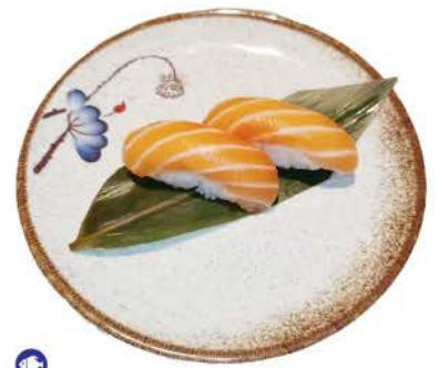
N1 / Sake salmone,riso salmon, rice € 2,50