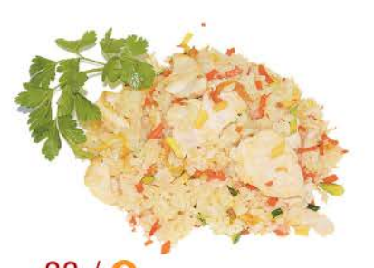
23 / ○ Riso con Pollo Saltati uova,pollo,carote,verdure eggs, chicken, carrots, vegetables € 5.00