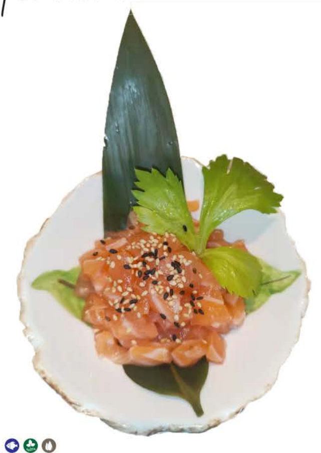
TA1 / Salmone Tartar salmone, sesamo e salsa dello chef salmon, sesame and chef sauce € 6,00