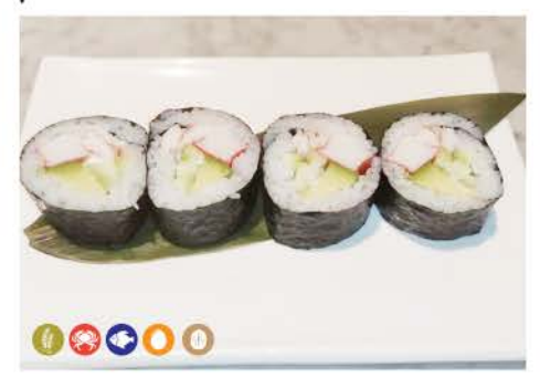
F1 / California surimi,avocado,cetriolo gamberoni,maionese surimi, avocado, cucumber king prawns, mayonnaise € 5,00