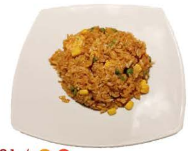
21 / ○ ② Riso Thailandese uova,gamberi,piselli,mais piccante eggs,shrimp,peas,corn,spicy € 6,00