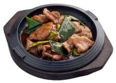
40 / @ ○ Manzo alla Piastra grilled beef € 8,00