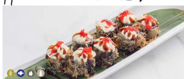
H6 / Miss Philadelphia avocado,philadelphia,kataifi tobiko,alghe,sesamo avocado, philadelphia kataifi tobiko, seaweed, sesame € 12,00 max 1 porzione / persona