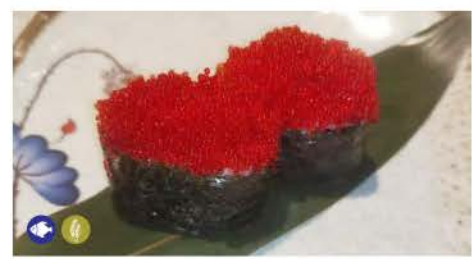
G3 / Tobiko uova di pesce fish eggs € 3,00