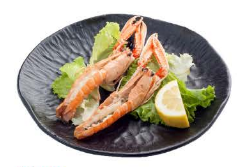
42 / ② Scampi scampi € 8,00 / 2pz