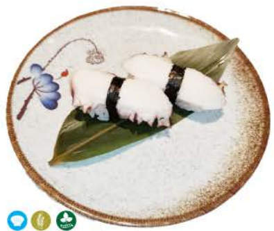
N2 / Tako polipo,riso,alghe octopus, rice, seaweed € 2,50