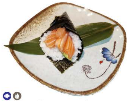
T1 / Sake Temaki avocado,salmone,riso,alghe avocado,salmon,rice,seaweed € 4,00