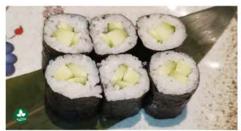
H5 / Kappa Maki cetriolo cucumber € 4,50