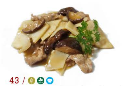
Manzo con Funghi e Bambù beef with mushrooms and bamboo € 8,00