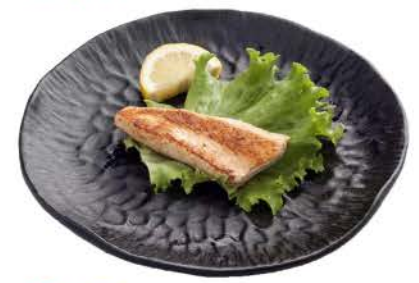
46 / ♥ Shake salmone alla grgila grilled salmon € 8,00