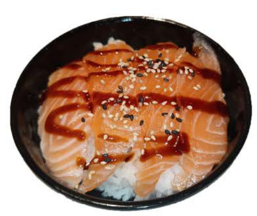
C1 / ♠ ♠ ♠ ♠ ♠ On Chirashi Sake Don ciotola di riso con salmone crudo, salsa bowl of rice with raw salmon, sauce € 5,00