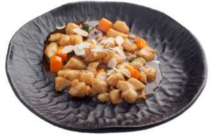
37 / @ @ @ ○ Pollo alle Mandorle almond chicken € 7,00