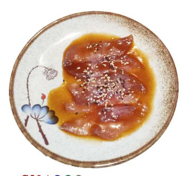
CA2 / ♠ ♠ ♠ ↑ Tonno carpaccio di tonno,sesamo e salsa carpaccio of tuna, sesame and sauce € 5,00