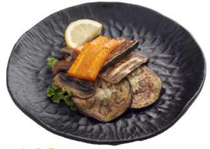
53 / 0 Verdure Grigliate 5 € 5,00