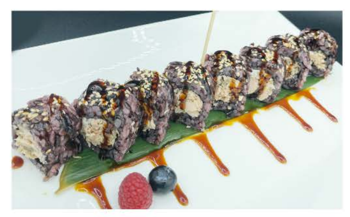
B4 / ○ ○ ○ ○ ○ ○ ○ ○ ○ Black Miura riso venere con salmone cotto, philadelphia sesamo e salsa teriyaki black rice with cooked salmon, philadelphia sesame and teriyaki sauce € 10,00