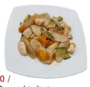
30 / Gnocchi di riso con pollo verdure e pollo vegetables and chicken € 7.00