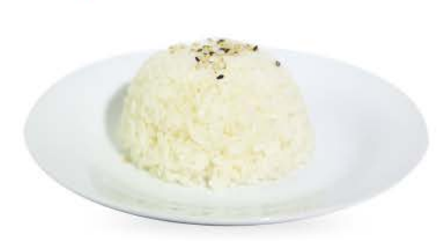
24 / © Gohan riso bianco cotto al vapore steamed white rice € 2.00