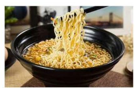
31 / Ramen con verdure e gamberi with vegetables and shrimps € 5,00