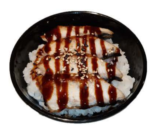
C3 / ♠ ♠ ♠ ♠ ♠ ♠ ♦ Chirashi Unagi Don ciotola di riso con anguilla salsa bowl of rice with eel, sauce € 6,00