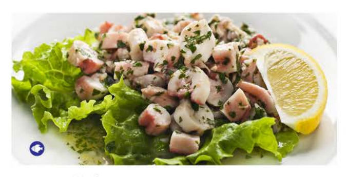
05 / Polipo octopus € 7,00