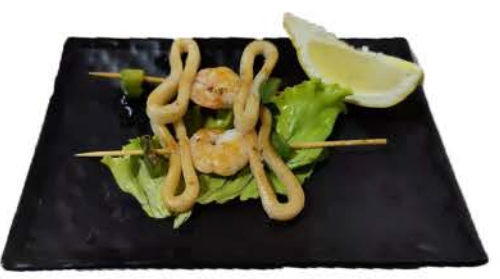
47 / ① Mix Kushiyaki spiedini di gamberi,calamari shrimp skewers, squid € 6,00