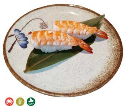
N4 / Ebi gamberetti cotti,riso cooked shrimp, rice € 2,50