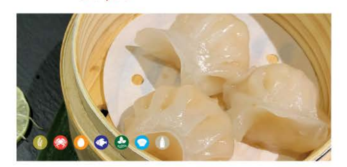
08 / Gyoza ebi ravioli di gamberi arrosto roasted shrimp ravioli € 5,00 / 3pz