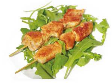
50 / ② Spicy Tori Kushiyaki spiedini di pollo chicken skewers € 6,00