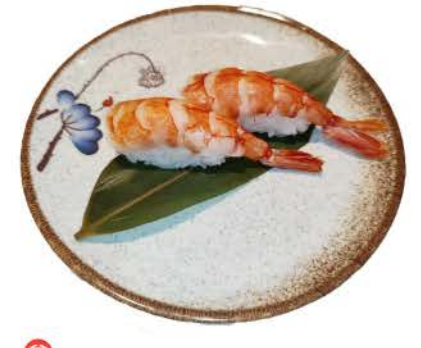
N8 / Amaebi gamberi crudi,riso raw shrimp, rice € 3,00