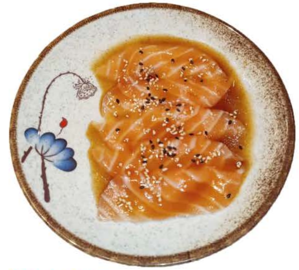
CA1 / ○ ○ ① Salmone carpaccio di salmone crudo, sesamo e salsa raw salmon carpaccio, sesame and sauce € 5,00