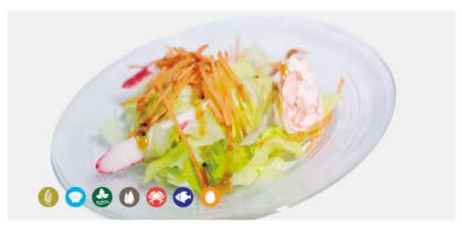
06 / California Salad insalata verde con gambero cotto surimi di granchio, sesamo e salsa green salad with cooked shrimp crab surimi, sesame and salsa € 7,00