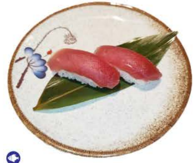
N3 / Maguro tonno,riso tuna, rice € 2,50