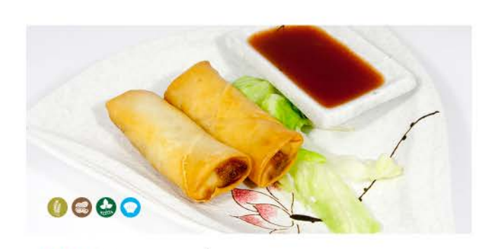
07 / Harumaki