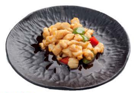
51 / ① Pollo in Salsa Piccante chicken in spicy sauce € 7,00