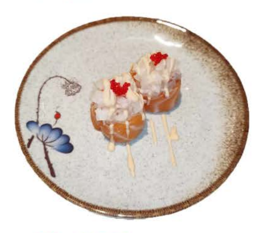
P12 / © O O O Gunkan Amaebi

philadelphia, tobiko, salmon on the outside \in 4.00