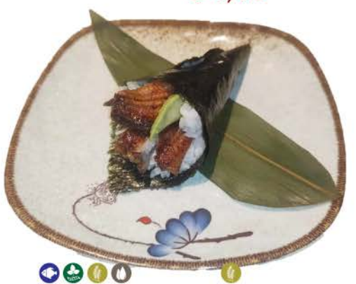
T5 / Unagi Temaki avocado, anguilla avocado, eel € 4,00