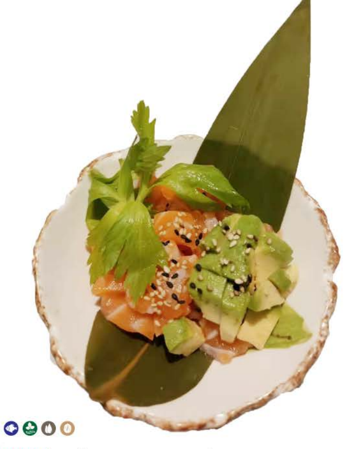
TA2 / Salmone Avocado Tartar salmone, avocado, sesamo e salsa dello chef salmon, avocado, sesame and chef's sauce € 6,00