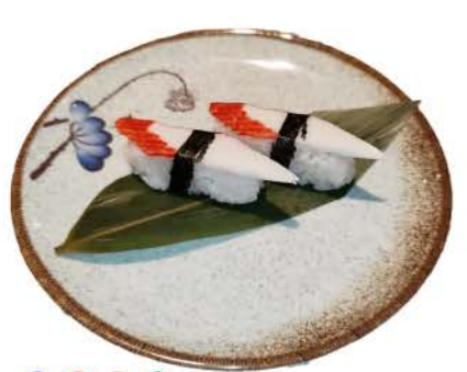
N6 / Surimi granchio,riso,alghe crab, rice, seaweed € 2,50