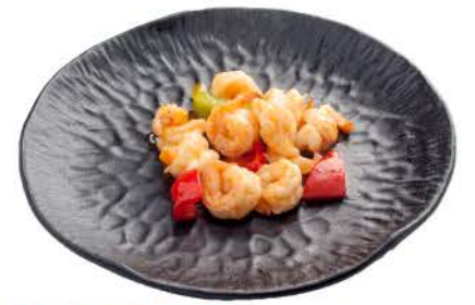
33 / ② ② ○ ○ Gamberetti Piccanti spicy shrimp € 7,00