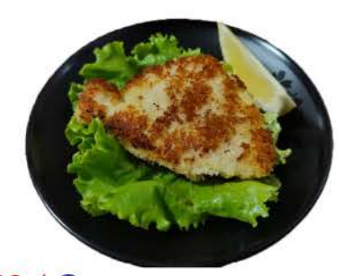
49 / ◆ Pesce Bianco white fish € 8,00