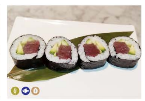
F3 / Maguro tonno,avocado,cetriolo tuna, avocado, cucumber € 5,00