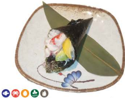
T3 / California Temaki surimi di granchio,avocado mango,maionese,riso,alghe crab surimi,avocado,mango mayonnaise,rice,seaweed € 4.00