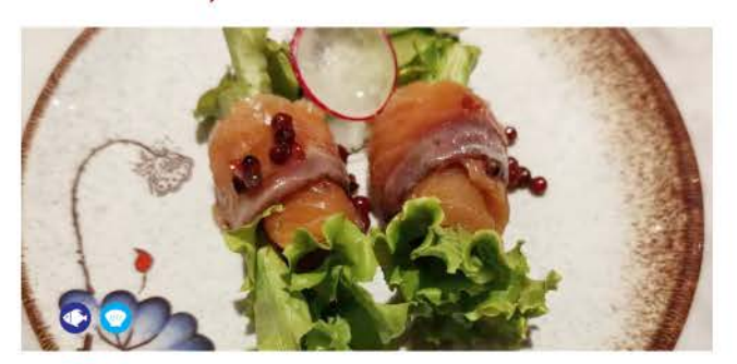
03 / Salmone Affumicato smoked salmon € 5,00

insalata di alghe piccanti con sesamo spicy seaweed salad with sesame € 3.00