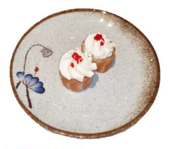
P11 / © © © © Gunkan Salmone philadelphia, tobiko, salmone all' esterno philadelphia, tobiko, salmon on the outs

philadelphia, tobiko, salmon on the outside \in 4.00